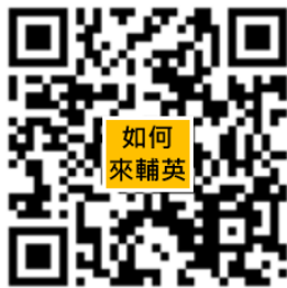
輔英科技大學交通資訊 (大眾運輸／自行開車)