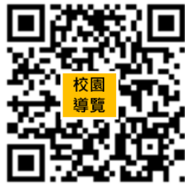
輔英科技大學校園導覽圖